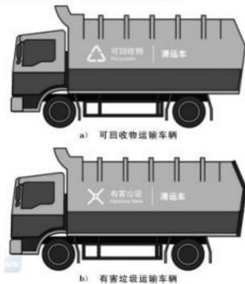
图 B.5 运输车辆分类标志设置效果示例