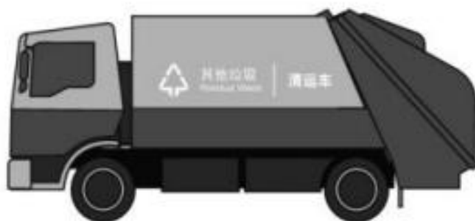
d) 其他垃圾运输车辆