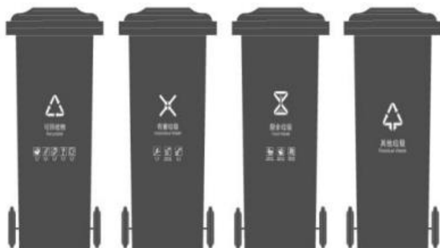
图 B.4 生活垃圾分类垃圾桶印刷式标志设置效果(大类、小类组合标志)示例

B.4 生活垃圾分类垃圾桶印刷式标志设置效果(大类、小类组合标志)示例见图 B.4,其中,示例中的灰色仅代表实际应用时基材本身的颜色。