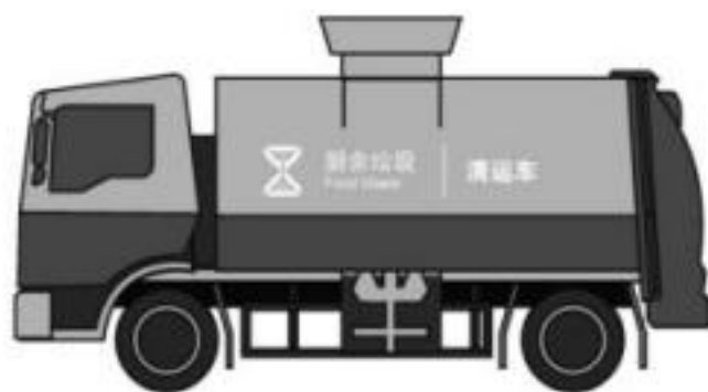
c) 厨余垃圾运输车辆