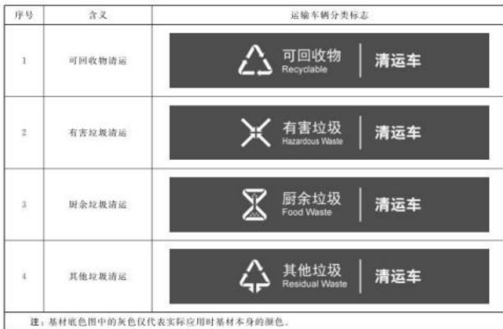
表 B.1 运输车辆分类标志设置方案