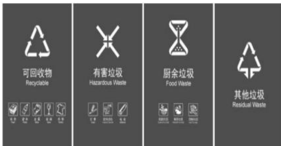
图 B.2 生活垃圾分类垃圾桶大类、小类组合标志设置方案(基材底色白图)示例

B.2 生活垃圾分类垃圾桶大类、小类组合标志设置方案(基材底色白图)示例见图 B.2,其中,示例中的灰色仅代表实际应用时基材本身的颜色。