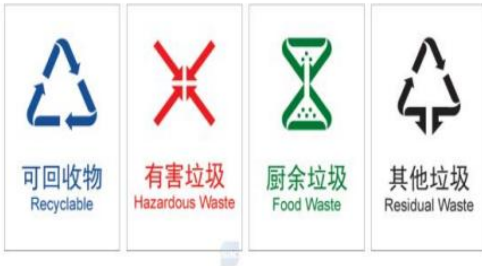
图 B.1 生活垃圾分类垃圾桶独立大类标志设置方案(白底彩图)示例

B.2 生活垃圾分类垃圾桶大类、小类组合标志设置方案(基材底色白图)示例见图 B.2,其中,示例中的灰色仅代表实际应用时基材本身的颜色。