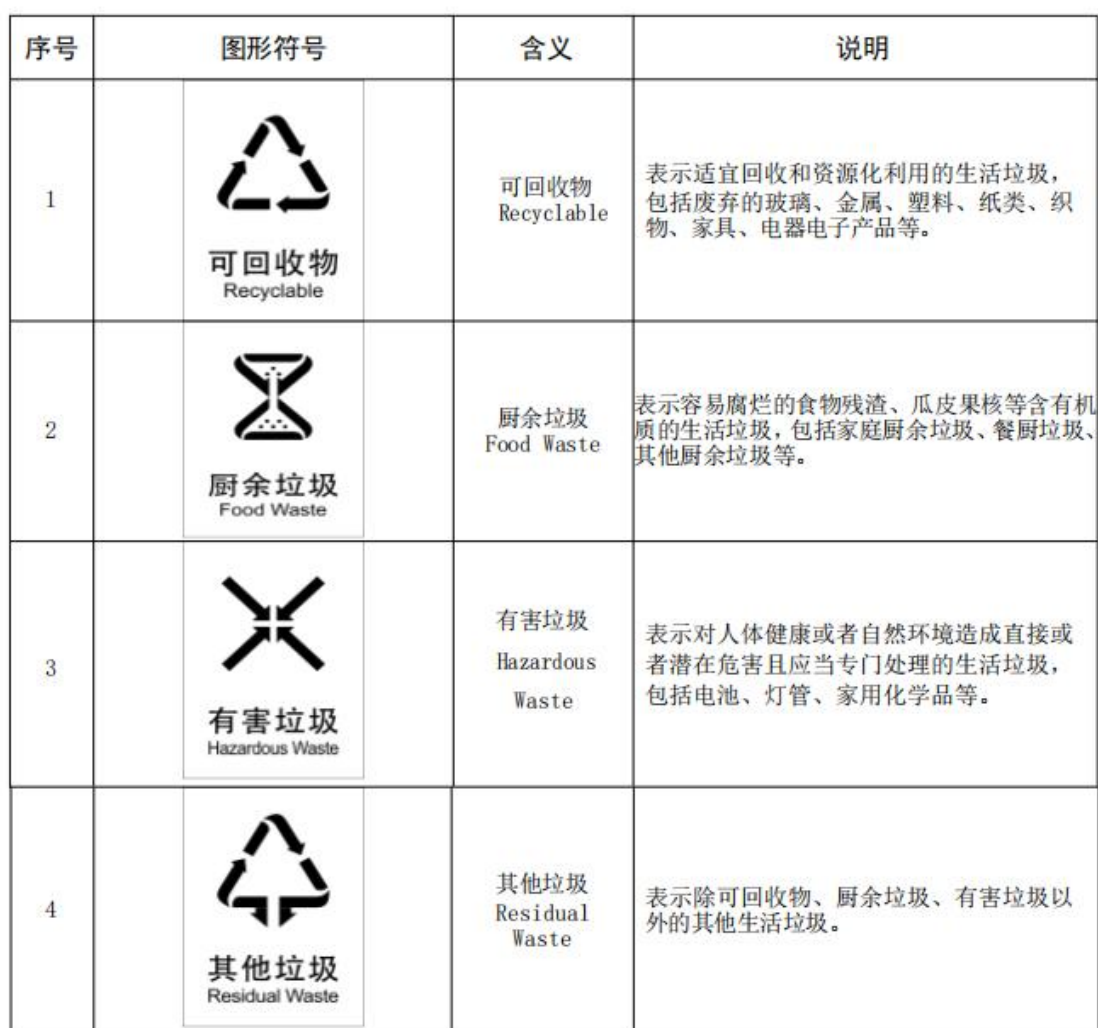
表 2 生活垃圾分类的大类标志