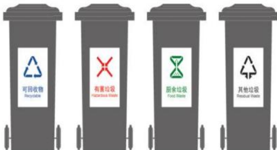
图 B.3 生活垃圾分类垃圾桶附着式标志设置效果(独立大类标志)示例

B.4 生活垃圾分类垃圾桶印刷式标志设置效果(大类、小类组合标志)示例见图 B.4,其中,示例中的灰色仅代表实际应用时基材本身的颜色。